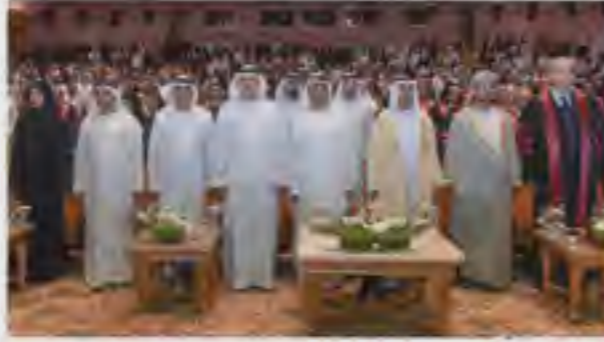
نهيان بن مبارك لدى حضوره حفل التخرج (وام)